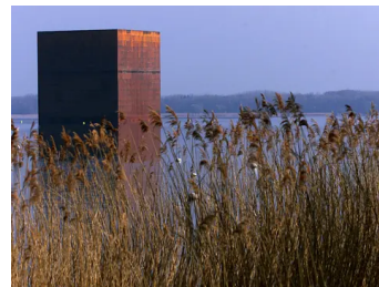
Der riesige Monolith im Murtensee verschwand nach der Expo.02.

Als aufgepfählte Pavillons, lose am Ufer verstreut, bildeten die sieben Cabanes ein Gegenüber zum riesigen Quader des schwimmenden Monolithen. Alle waren sie entworfen vom Pariser Architekten Jean Nouvel, der in der Schweiz für das majestätische Kultur- und Kongresszentrum am Ufer des Vierwaldstättersees bekannt ist. In Luzern reflektiert eine glänzende Oberfläche das Spiel der Wellen, im Murtensee dagegen schützte eine Rostschicht den Monolithen und auch die Cabanes. Der sogenannte Corten-Stahl ist einprägsam: Rost-Orange leuchtete er über dem Wasser und vor der grünen Uferkulisse. Im Schatten des Schlossparks nun gleicht sich sein Rotbraun den Baumstämmen an.