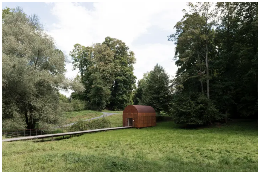
Jean Nouvels «Cabane», ehemals an der Expo.02, steht nun im Park des Schlosses Wartegg.